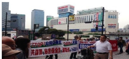
5.9 新宿駅頭で40人の大情宣

法案にたくさんの問題点があることは、今さら言うまでもない。冤罪を救う手立てが何もない法案だ。戦後7件目の死刑・無期懲役事件で再審無罪をかちとった経験から、ぼくは楽観主義者になった。チャンスはピンチ、ピンチはチャンスだと思っている。警察官という職業は、冤罪を作るものだと思う。社会や人の意識を変えれば、法案はつぶせる。これからも、希望をもって闘いたい。(5.26 えん罪をなくせ！ 盗聴法の拡大と司法取引の導入に反対する国会議員と弁護士の集い士・市民の集い 皇陵会館)