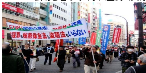
3.28 反“テロ”戦争反対！ 盗聴法改悪阻止を掲げ池袋駅頭デモ

法案にたくさんの問題点があることは、今さら言うまでもない。冤罪を救う手立てが何もない法案だ。戦後7件目の死刑・無期懲役事件で再審無罪をかちとった経験から、ぼくは楽観主義者になった。チャンスはピンチ、ピンチはチャンスだと思っている。警察官という職業は、冤罪を作るものだと思う。社会や人の意識を変えれば、法案はつぶせる。これからも、希望をもって闘いたい。(5.26 えん罪をなくせ！ 盗聴法の拡大と司法取引の導入に反対する国会議員と弁護士の集い士・市民の集い 皇陵会館)