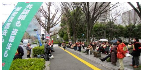
3.9 全国の争議団と法務省抗議 弁護士会館前で集会