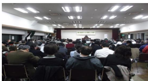
密告・盗聴反対！なくせ冤罪3.20集会 会場を埋め尽くす大盛況(実行委)